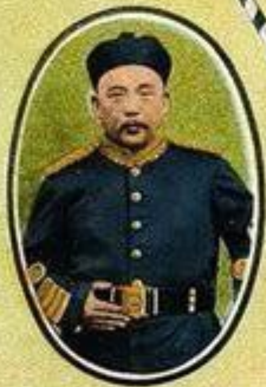
YUAN SHIH K'AI First President of the Chinese Republic.