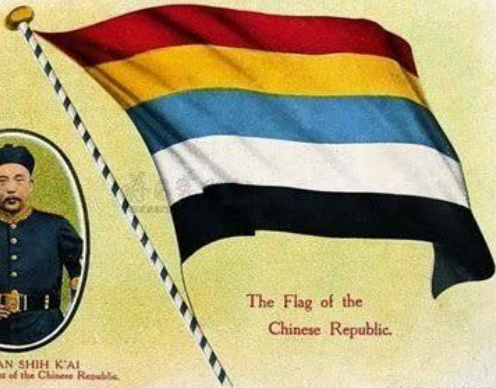
The Flag of the Chinese Republic.